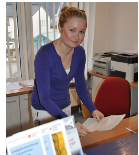
Kompetenz und Freundlichkeit werden bei uns Großgeschrieben.