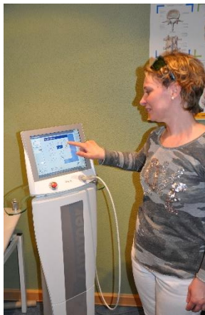
Diagnostik und Therapie sind unzertrennlich